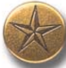
RUSA G 20