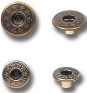
FIX CENTRAL Ø17

PINCHE CALOTADO Capped post-Mâle calotté