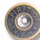
SPIRIT OF KHAKI