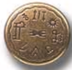
AZTECA G 16