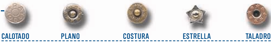
CALOTADO PLANO COSTURA ESTRELLA TALADRO

remache tejano jeans rivets rivets jeans