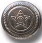
HORÓSCOPO G 1