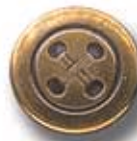
COSIDO G 18