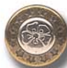
EST/TRE DC 109