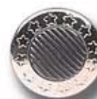
EST/RAY DC 106