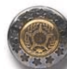
EST/ESP DC 108