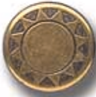
SOL G 26