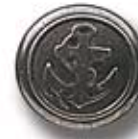
ANCLA G 29