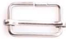
HEBILLA CORREDERA hierro 25/30/40 Sliding buckle (steel) - Boucle coulissante (acier)