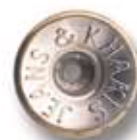
JEANS & KHAKIS