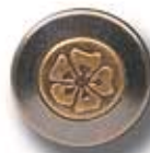
LISO/TRE DC 104