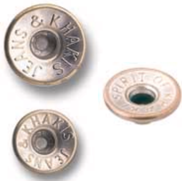
FIX CENTRAL HUNDIDO 14 MM

PINCHE CALOTADO Capped post-Mâle calotté