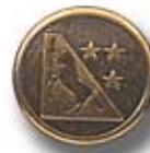
CABALLO G 4