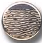
TERRA G 17