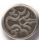
ERETRIA G 25