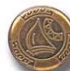
ELEMENTS G 24