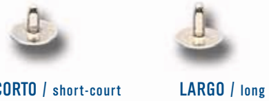
CORTO / short-court LARGO / long