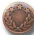
LAUREL G 14