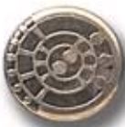
ASTRAL G 23