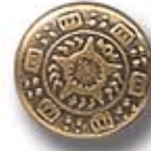
CENEFA G 28