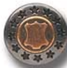
EST/CUERO DC 111