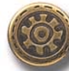
NIRVANA G 19