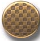
CUADROS G 6