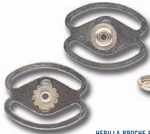
HEBILLA BROCHE 8020 latón Snap buckle 8020 (brass) - Bouton pression boucle 8020 (laiton)

HEMBRA Y CALOTE 8020 Socket and Cap 8020 Oillet à ressort et calotte 8020