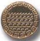
HIDROS G 22