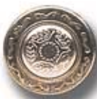
GEN/ESP DC 121