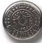
CENEFA G 13