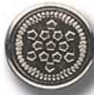
ESTRELLAS G 15