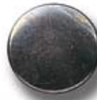
LISO G 00