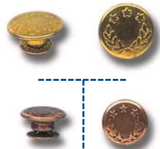
MOVIBLE Ø17 Ø14

Chincheta Movable Mobile Pin Pointe Mobile