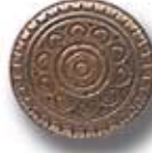
ÁRABE G 27