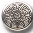
EDELWEISS G 21